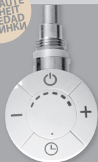
H1 / H2

NOVITÀ NEW NOUVEAUTÉ NEUHEIT NOVEDAD НОВИТКИ