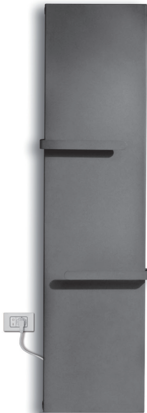
design by Massimo Porta

Interasse dal centro foro al muro 55 mm. Distance between hole center and wall 55 mm. Distance du centre du trou au mur 55 mm. Abstand zwischen Lochmitte und Wand 55 mm. Distancia entre el centro del agujero y el muro 55 mm. Расстояние между центром отверстия и стеной — 55 мм.