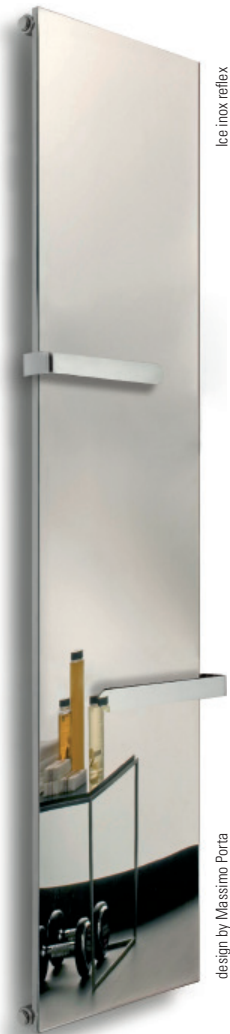
Ice inox reflex

Это не зеркало. Полотенцедержатели хромированы.